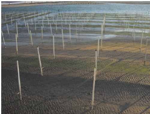
浅瀬の海中の支柱、杭としてもお使い頂けます。