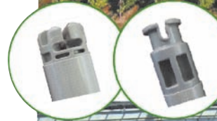
左:エンドキャップ A 右:エンドキャップ B